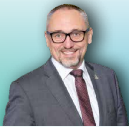
Günter Riemer Bürgermeister, 58, Kirchheim unter Teck

Anforderungen des Klimawandels, der Digitalisierung, der mobilen Gesellschaft und des demografischen Wandels brauchen Lösungen. Ich will aktiv daran mitwirken.