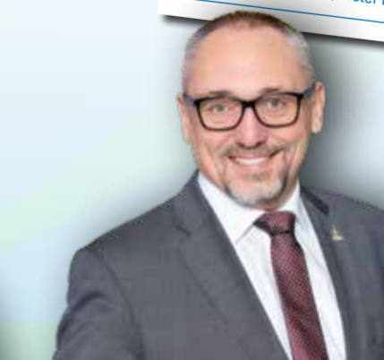
Günter Riemer Bürgermeister, Kirchheim unter Teck

Die dynamische Region braucht eine mutige Planung für Lebensraum und Mobilität. Dies gemeinsam zu gestalten, ist meine Motivation.