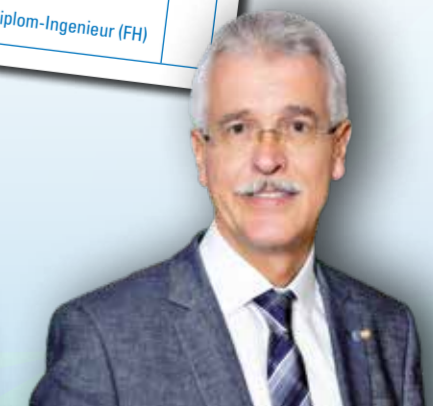
Rainer Lechner Erster Bürgermeister, Ostfildern

Der Alltag vieler Menschen spielt sich in der ganzen Region ab. Wohnen, Arbeiten und Freizeit sind nicht lokal begrenzt. Dafür braucht es gute regionale Ideen.