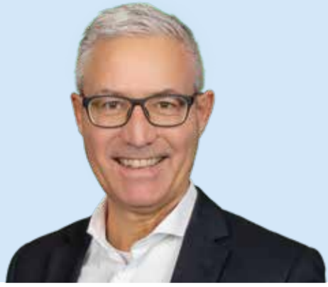
Ingo Hacker Bürgermeister, 61, Neuhausen