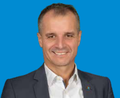
Frank Buß Bürgermeister, Diplom-Verwaltungswirt (FH), 59, Plochingen