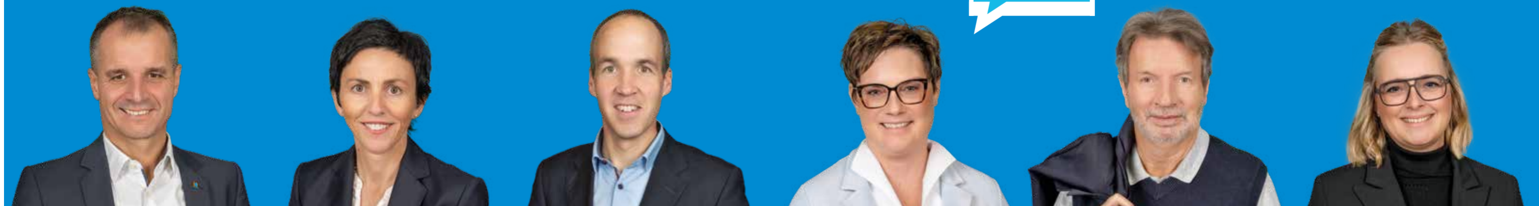
Frank Buß Bürgermeister, Diplom-Verwaltungswirt (FH), 59, Plochingen